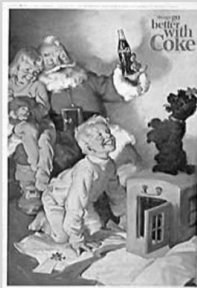
ANEXO A – Propaganda da Coca-Cola em 1964