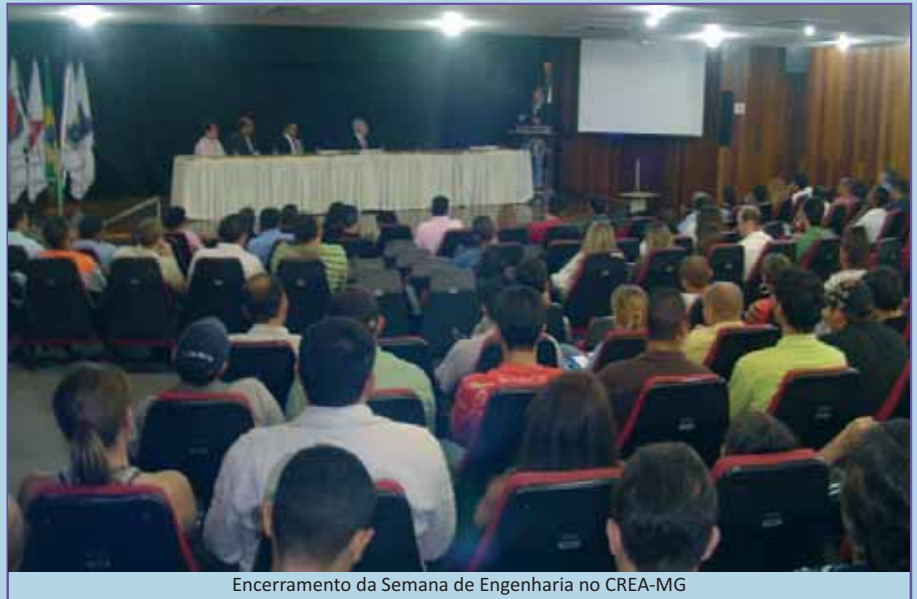
Encerramento da Semana de Engenharia no CREA-MG

O encerramento do evento aconteceu no dia 15 de maio, à noite, no salão do CREA-MG.